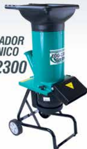
TRITURADOR ORGÂNICO TOG-2300