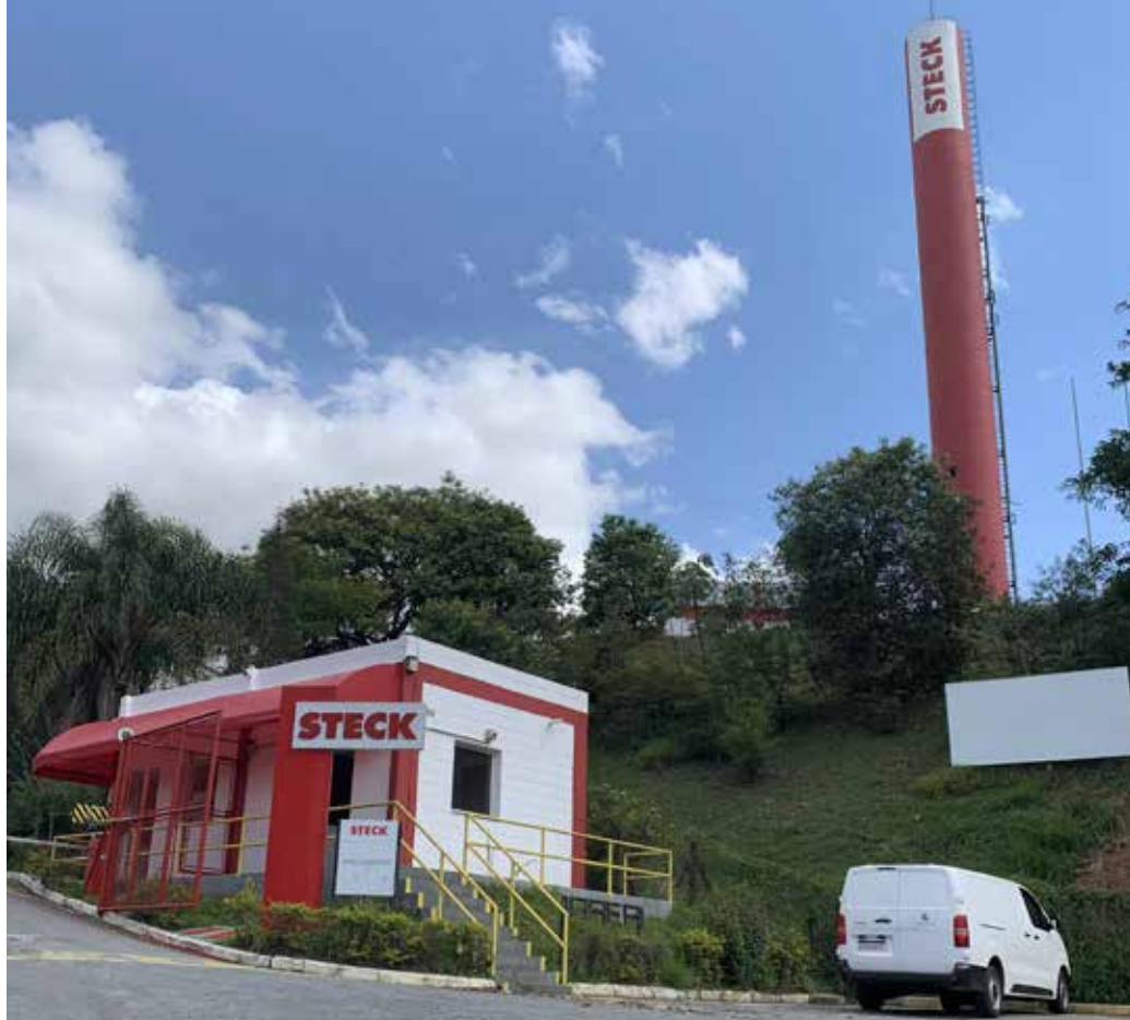
fábrica da Stock em Itaquera