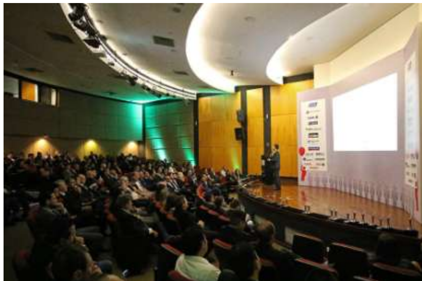
Apresentação de Palestrante convidado – Tendências e Economia