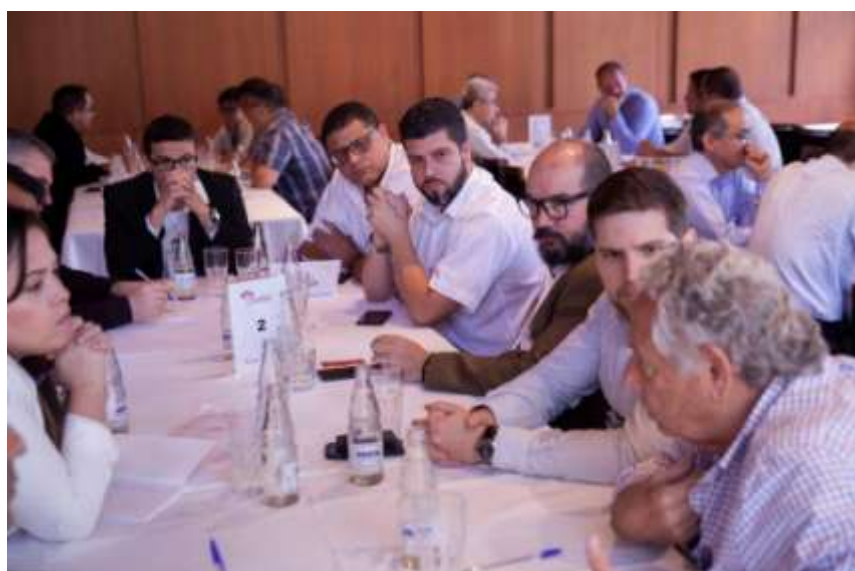
Rodada de Conteúdo e Negócios