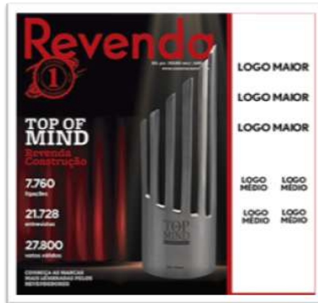
Folder de Capa