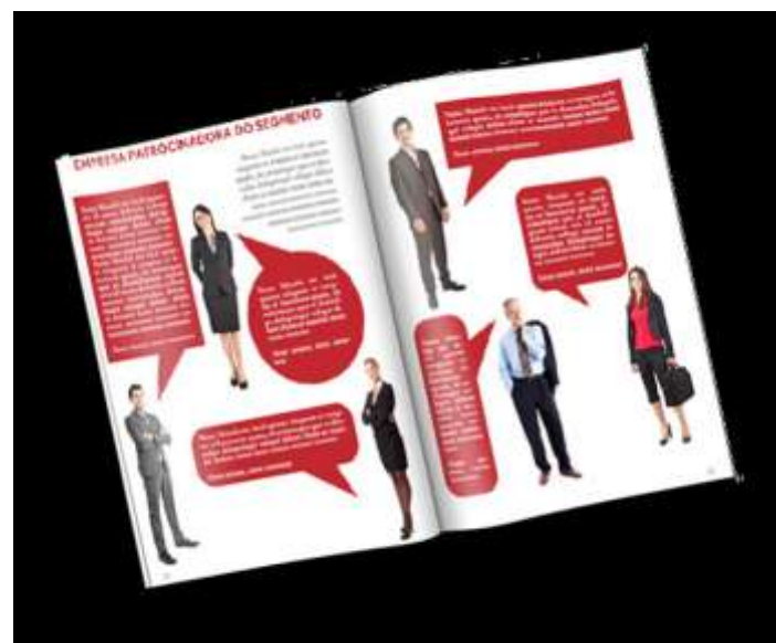
Depoimentos 1/3 pág