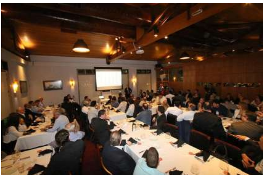
Apresentação de dados macroeconômicos