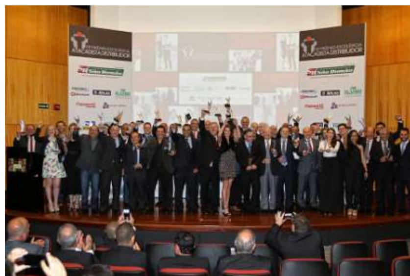
Premio Excelência Atacadistas Distribuidores