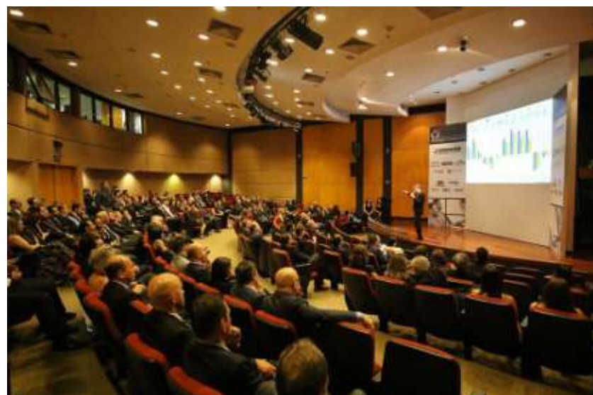
Apresentação Pesquisa Relacionamento dos Lojistas com Atacadistas e Distribuidores