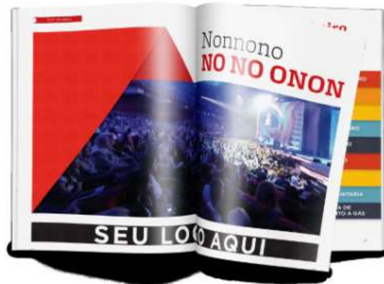
Logomarca no rodapé da página