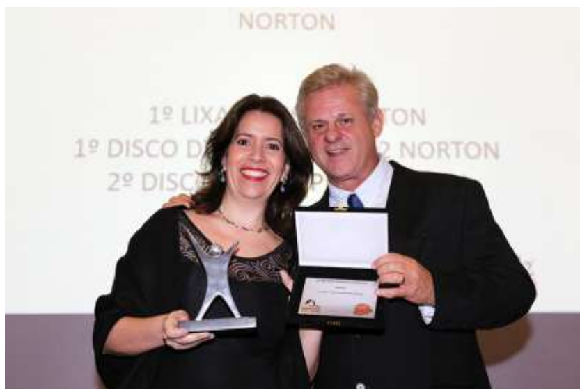
Entrega da premiação para as indústrias pelos lojistas e atacadistas