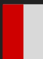
1/2 de Página Vertical 10 X 27,5 cm R$ 13.670,00