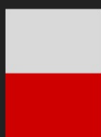
1/2 de Página Horizontal 20,5 X 13,75 cm R$ 13.670,00