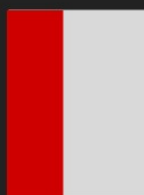
2/3 de Página 13 X 27,5 cm R$ 17.810,00