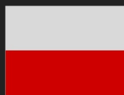
1/2 de Página Dupla 41 X 13,75 cm R$ 25.385,00