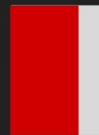
1/3 de Página 7 X 27,5 cm R$ 19.170,00